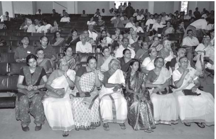
സദസ്സിന്റെ ഒരു ദൃശ്യം