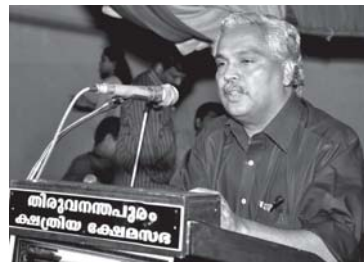
സമാപനസമ്മേളനം ബഹു. കേരളവനം, ഭവനവകുപ്പ് മന്ത്രി ശ്രീ ബിനോയ് വിശ്വം ഉദ്ഘാടനം ചെയ്യുന്നു.