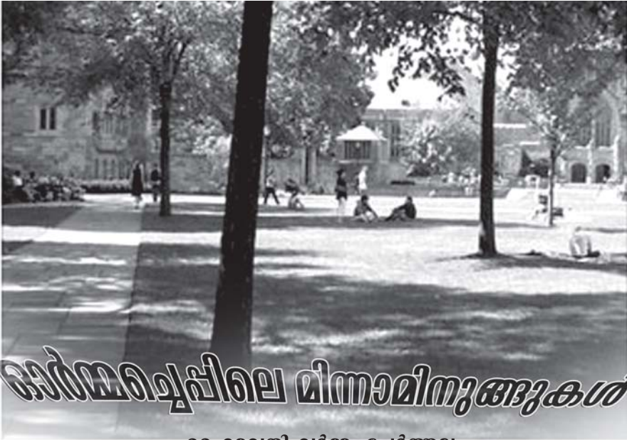
ഹൈമവതി വർമ്മ, ചേർത്തല